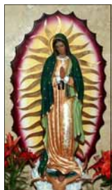
- ഒരു വിശ്വാസി