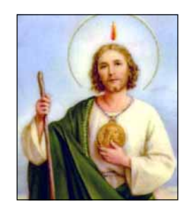
- ഒരു വിശ്വാസി