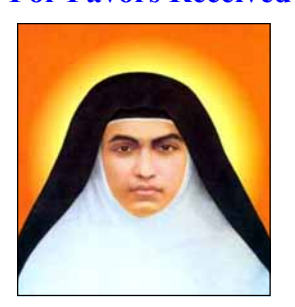
- ഒരു വിശ്വാസി