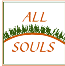
C.T.S. Parish Co., Inc.

മുൻ പതിവുപോലെ രണ്ടു പള്ളികളിലെ കർണ്യാനകൾക്കും സെമിത്തേരിയിലും നിങ്ങളുടെ പ്രിയ പരേതരുടെ ഹോട്ടോകൾ കൊണ്ടുവന്നു വയ്ക്കാവുന്നതാണ്.