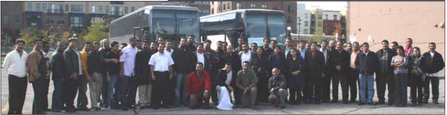
Participants of Tour to Minneapolis/St. Paul to attend inauguration of Knanaya Mission of Minnesota.