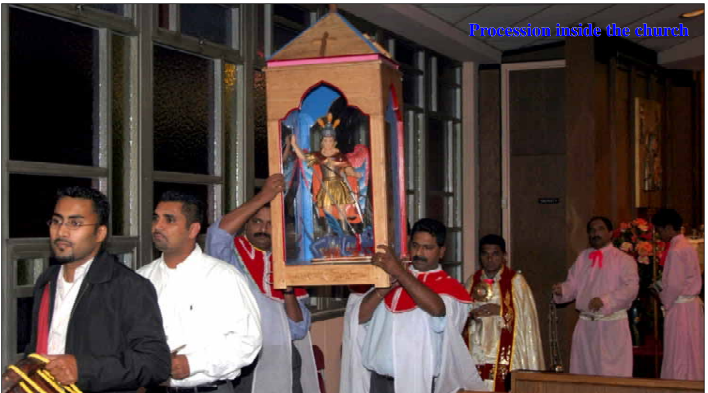
Procession inside the church