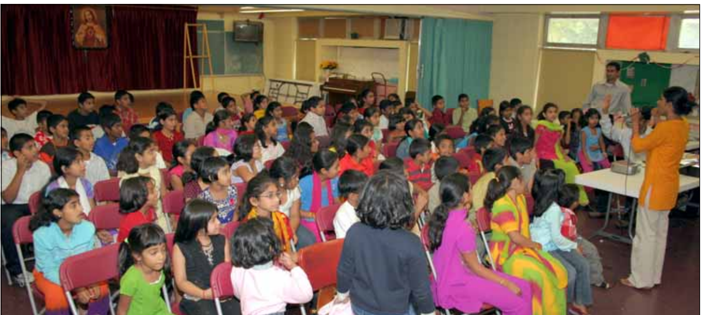
Children Ministry at Maywood by Christine Team.

ഒക്ടോബറിലെ മൂന്നും നാലും ആഴ്ചകളിൽ (16 - 20 & 23-27) തിങ്കൾ മുതൽ വെള്ളി വരെ വൈകുന്നേരം 7:00 ന് കമ്മ്യൂണിറ്റി സെന്ററിൽ കുർബ്ബാനയും കൊന്തയും ഉണ്ടായിരിക്കും.