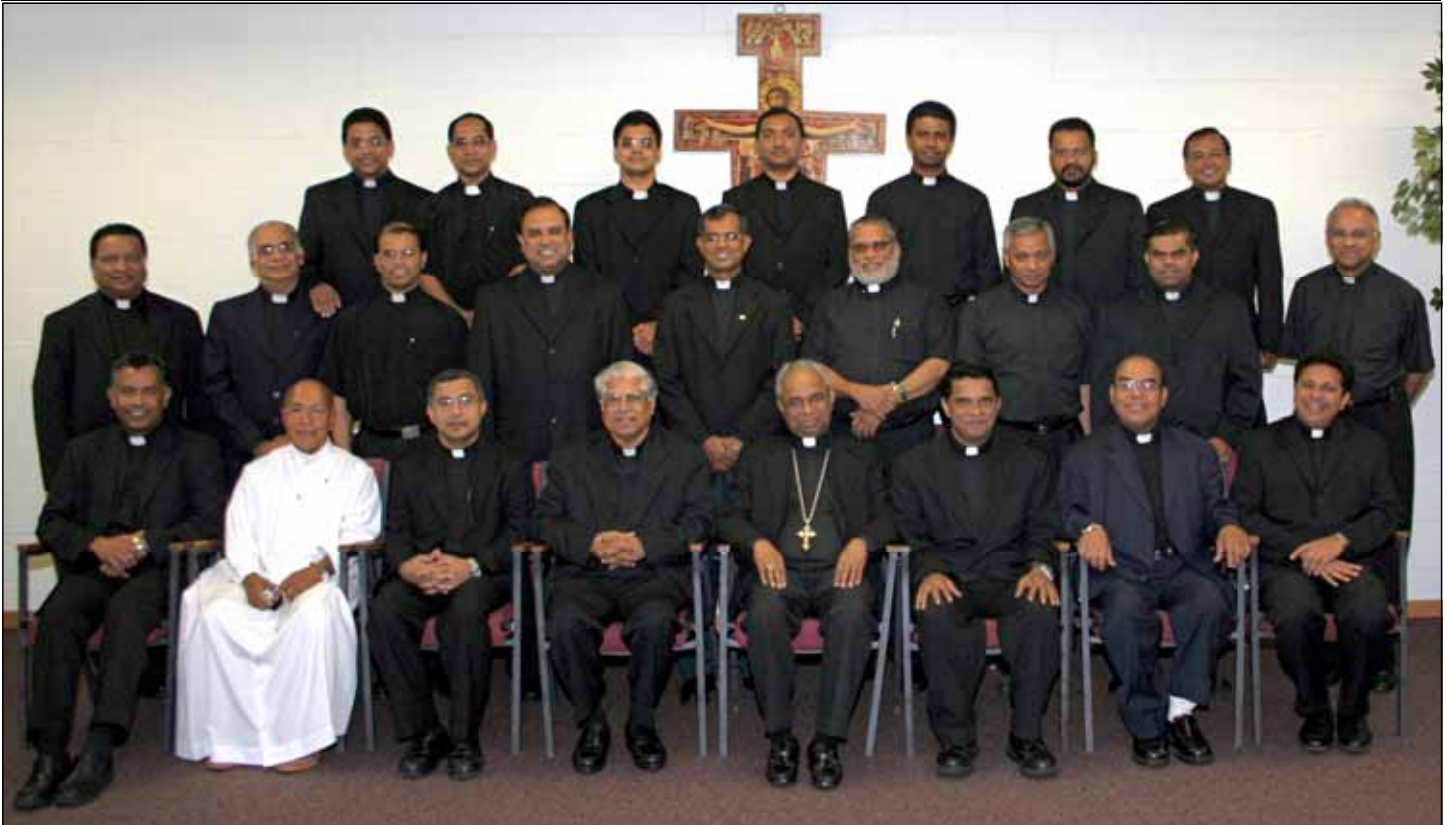
Participants of the presbyterial council of the Syro-Malabar Diocese of Chicago 2006