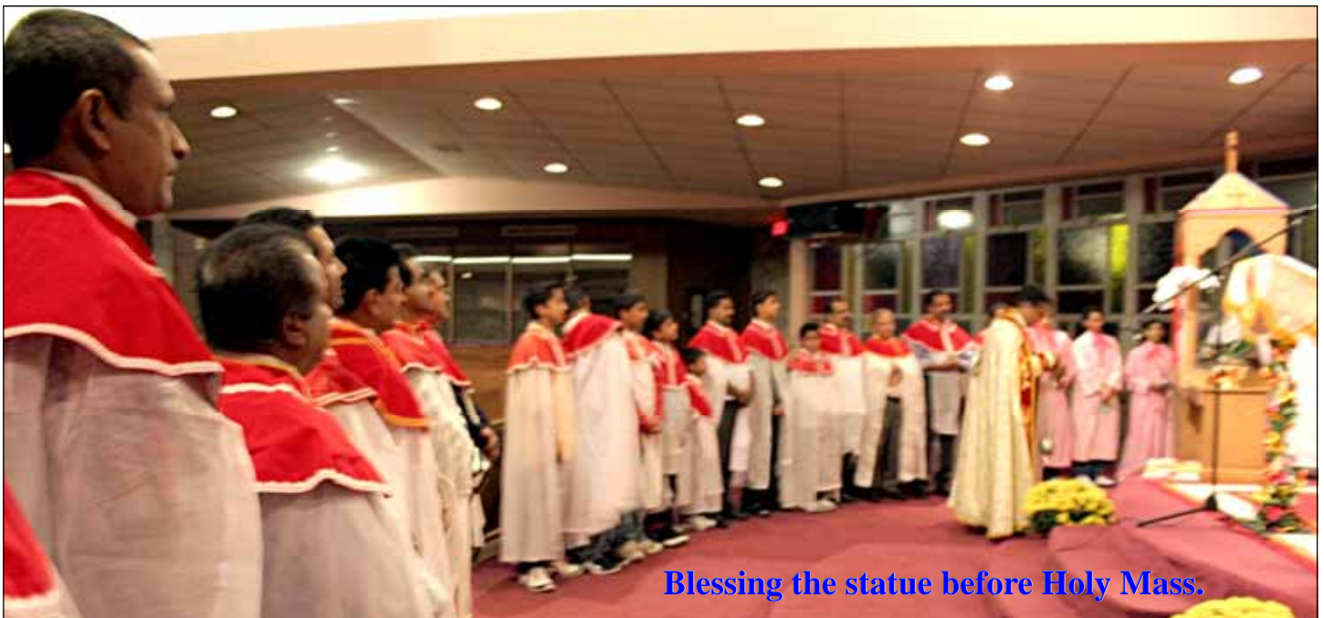
Blessing the statue before Holy Mass.